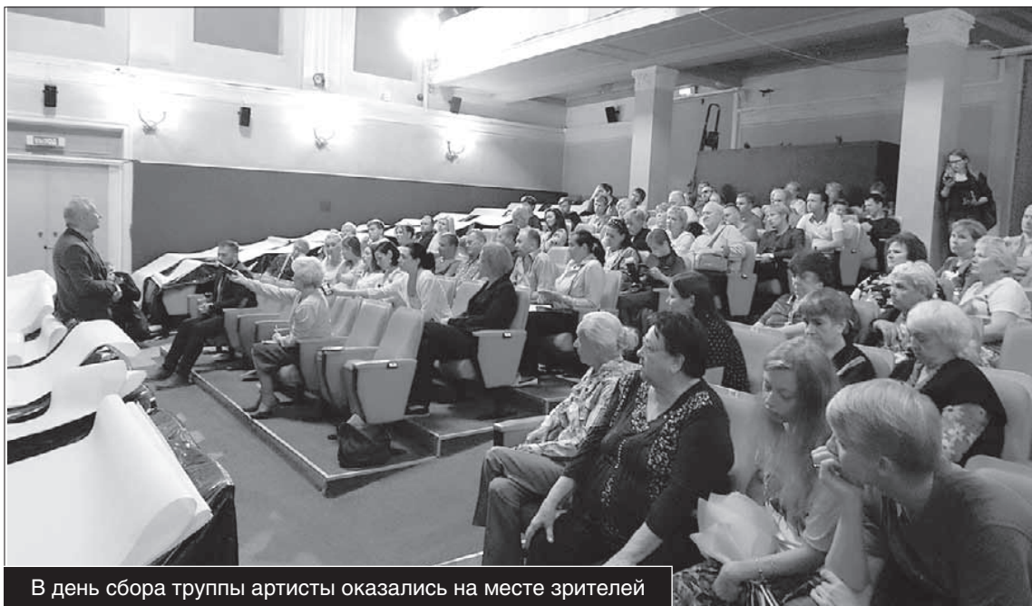
В день сбора труппы артисты оказались на месте зрителей

дут выступать в нашем городе, тверские артисты займут место на саратовской сцене. 11 октября Тверской ТЮЗ представит премьеру — «Сказку о царе Салтане»,